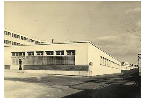
Le lycée en 1948