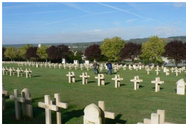
Le cimetière militaire côté français.

Un mémorial a été construit dans les années 20 pour commémorer ces 2 batailles et un cimetière militaire témoigne de la violence des combats de 1918.