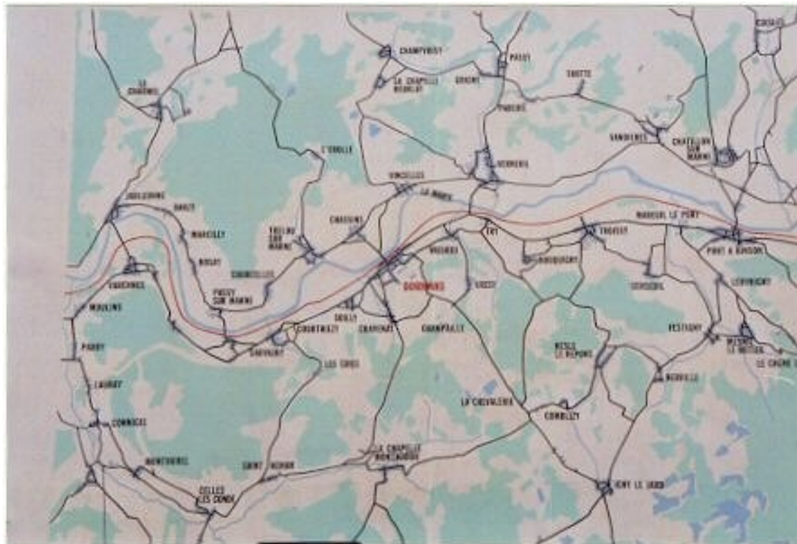
Carte de Dormans et ses environs, visible sur un mur de la place de l'église.

Commune rurale à vocation exclusivement agricole et viticole Soilly ne pouvait faire face aux aménagements nécessaires que chaque habitant est en droit d'attendre de la communauté. C'est pourquoi, le 6 janvier 1969, en présence de Monsieur Mouret, Sous-Préfet de l'arrondissement d'Eprenay, était ratifiée la fusion des communes de Soilly et de Dormans.