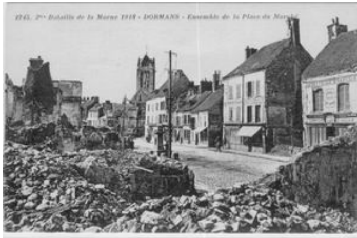
La ville de Dormans a été énormément détruite pendant cette période.