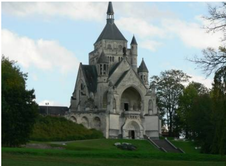
Le mémorial des batailles de la Marne

L'armée française se replie depuis le 24 août jusqu'au 5 septembre avec un violent combat contre les allemands le 3 septembre. Le 6 septembre le général Joffre donne l'ordre de passer à la contre-offensive. Suite à cette bataille, les Allemands se replient . Le 10 septembre l'armée française est de retour à Dormans.