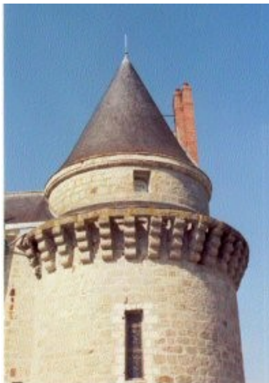
Vue actuelle d'une tour du château

Dormans entra dans le domaine de la couronne, le jour où Jeanne de Navarre, Comtesse de Champagne épousa Philippe le Bel en 1284, elle lui apporta en dot notre province, mais voulant récompenser une famille qui avait servi loyalement pendant de longues années, elle érigea en Châtellenie la terre de Dormans et en fit don à Jean 1er, celui-ci en prit le nom et fut très peu de temps le Procureur du Roi au Parlement de Paris.