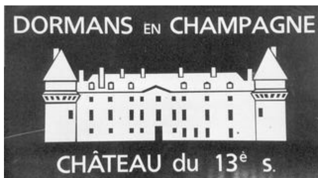
Panneau signalétique à l'entrée de Dormans il y a quelques années.

Par la suite, la famille de Dormans s'installa au Château, cette famille devait rester illustre par sa descendance dont tous les membres furent de célèbres serviteurs du royaume et occupant les postes les plus élevés (trois furent Grands Chanceliers, deux évêques de Grand Siècle.) Le fils de Jean 1er, Jean II devint évêque de Beauvais, puis cardinal et Chancelier . Sous Charles V il fonda à Paris, le 8 mai 1370 le célèbre Collège de Dormans où l'enseignement au niveau très supérieur était pratiqué.