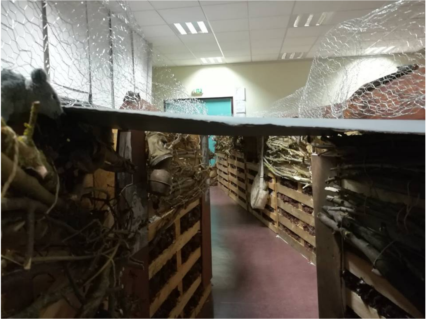
Reconstitution d'une tranchée avec des effets sonores et visuels

', $('textarea[name=texte]')[0] ;" style="text-align : center" title="">